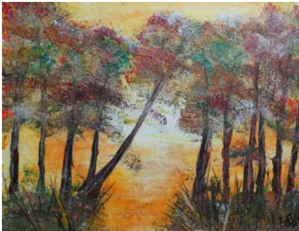
Enkaustik-Bild von Hanni Pils, Mitterfelden