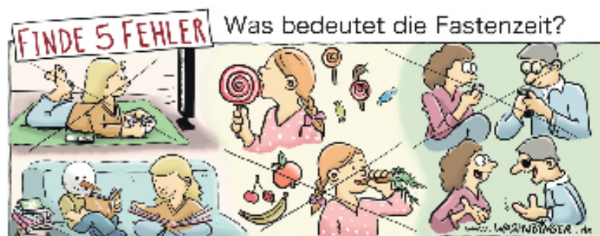
Sonnenbrille, Sonnenbrille, Sonnenbrille, Sonnenbrille, Sonnenbrille

auf Süßigkeiten. Aber der Sinn ist nicht, auf etwas zu verzichten, um zum Beispiel schlanker zu werden, sondern um sich auf das Leiden und Sterben Jesu vorzubereiten. Das steht nämlich am Ende der Fastenzeit, am Karfreitag. Deshalb heißt die Fastenzeit auch Passionszeit. Passion ist ein lateinisches Wort und heißt Leiden. Nicht wir selbst sollen leiden, sondern wir bereiten uns vor auf das Leiden Jesu. Indem wir zum Beispiel in der Bibel lesen, anderen Menschen helfen, den Geschwistern und Eltern zum Beispiel. Indem wir nicht so sehr an uns denken, sondern an andere, wie Jesus nicht an sich gedacht hat, sondern an uns.