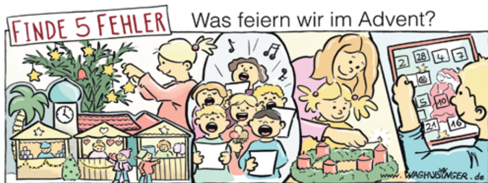
Palme, Tulpe, Eis, Ste Kerze, Türchen Nr. 28

Und vieles andere mehr. Ich fände es schön – und ich versuche es auch jedes Jahr –, wenn es auch ruhige Momente im Advent gibt. Damit ich mich auch innerlich ein bisschen auf Weihnachten vorbereiten kann, darauf, dass Jesus geboren ist. Darüber nachzudenken, was für ein großes Geschenk wir Menschen bekommen haben, dass Gott Mensch geworden ist. Dass er uns so sehr liebt. Das freut mich, und dann überlege ich mir, wie ich anderer eine Freude machen kann. Jetzt im Advent. Den Mitschülern, den Eltern oder Großeltern. Weihnachten ist ein Fest der Freude, und die Freude wird größer, wenn ich mit meinen kleinen Möglichkeiten Freude teile. Nicht erst am 25. Dezember, sondern jetzt schon im Advent. Versucht das doch auch einmal. Es macht Freude, Freude zu schenken. Und die Wartezeit auf Weihnachten wird auch kürzer.